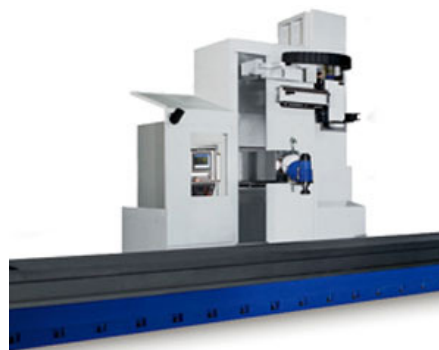
Bearbeitungszentrum für Großteile