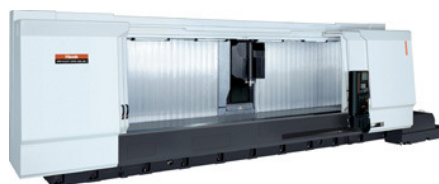
Bearbeitungszentrum mit Pendelbearbeitung